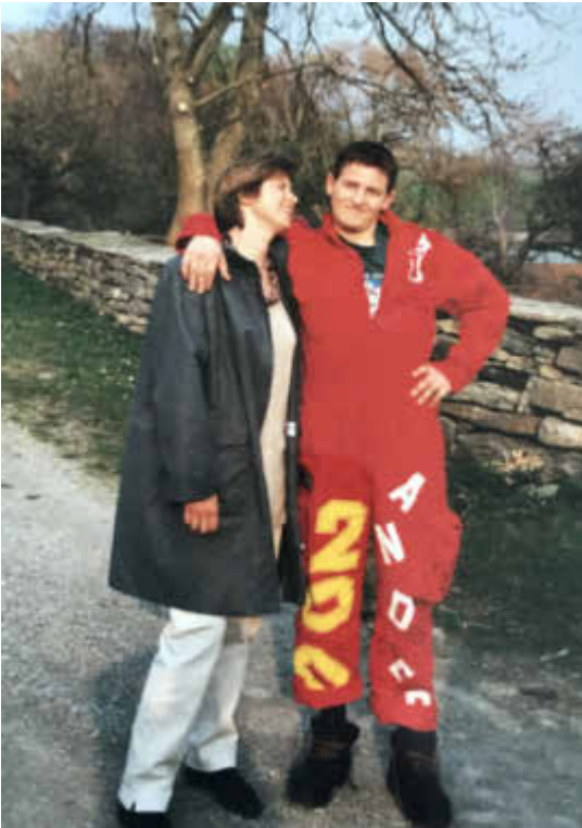
En mor og en russ på tunet i år 2000.